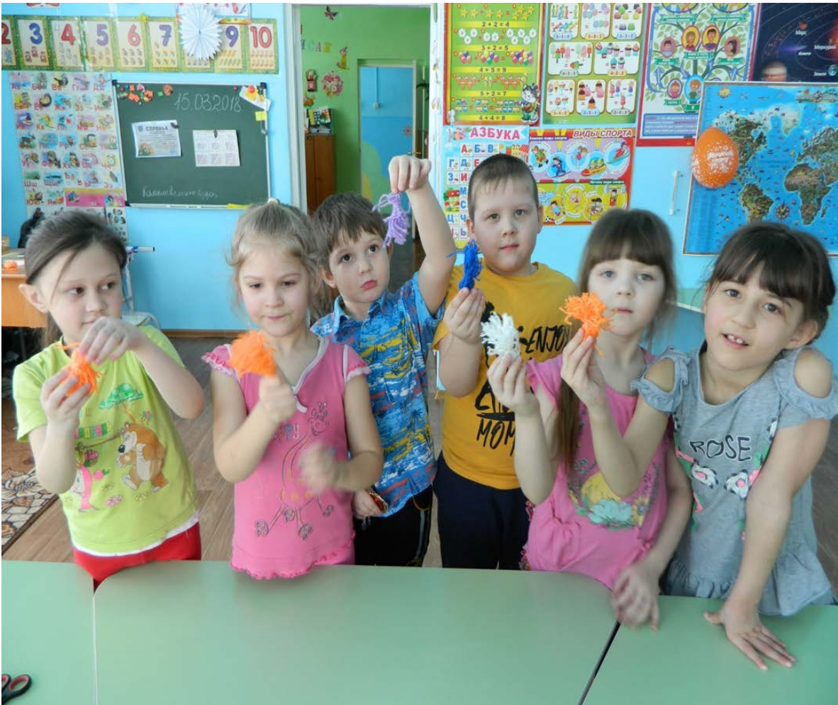
6 слайд Вот что у нас получилось.