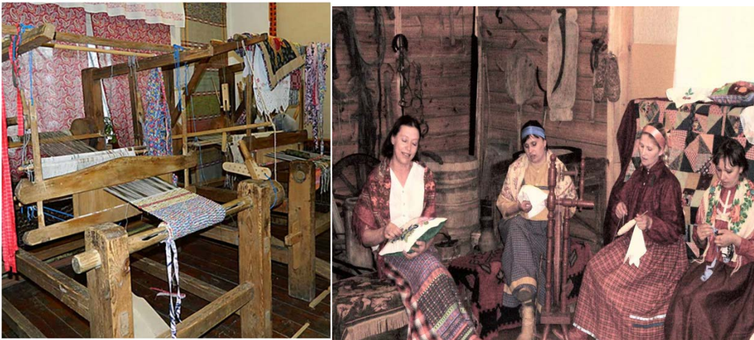
Так было в старину. 4 слайд