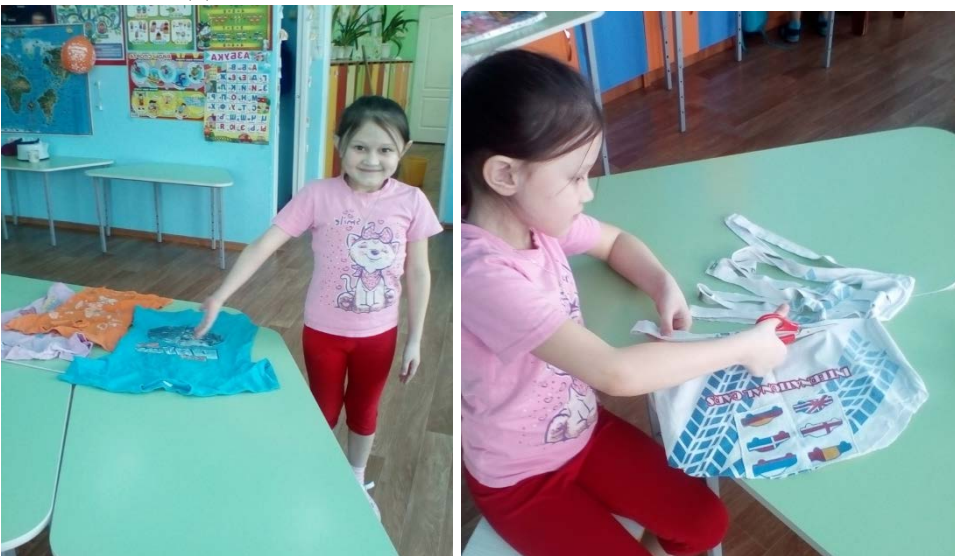
Как мы это делали