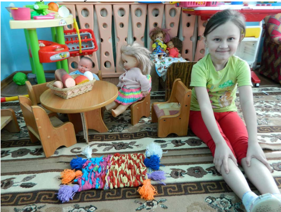
Коврик готов. Берегите нашу планету!!!