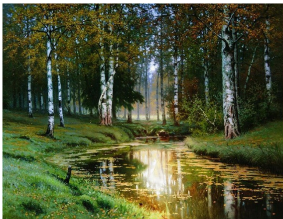
Пётр Кончаловский. Весенний день