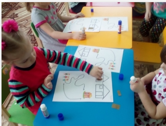
широкий – узкий