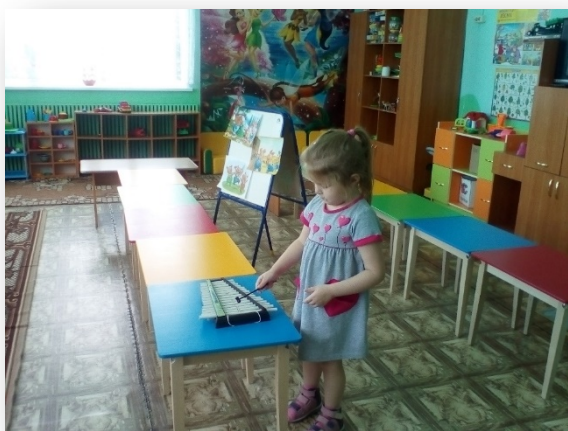
Игра на инструментах.