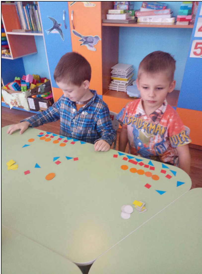
Занятие по математике